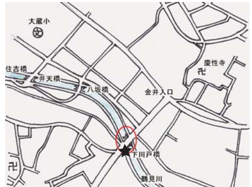
下川戸橋 10:00 ~ 12:00