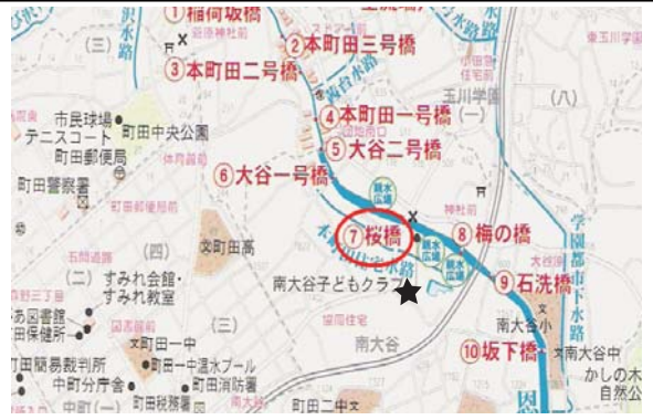
恩田川・桜橋親水施設 9:30 ~ 11:30