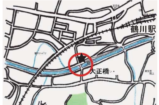
大正橋周辺 10:00 ~ 12:00