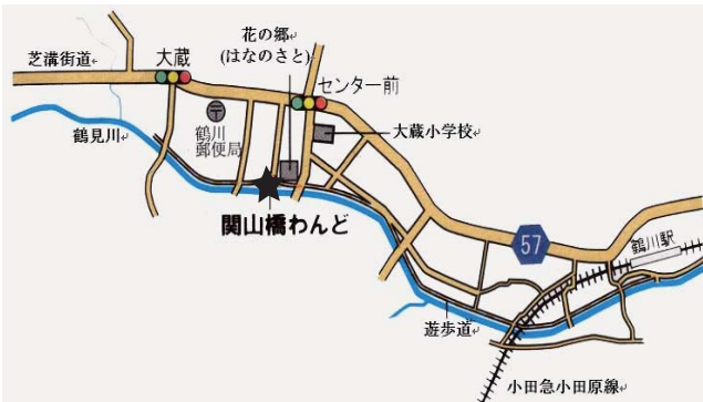
関山橋わんど 10:00 ~ 12:00