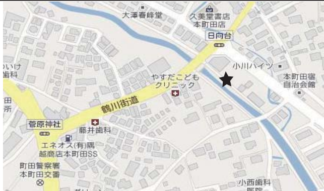
稲荷坂橋上流右岸 9:30 ~ 10:00