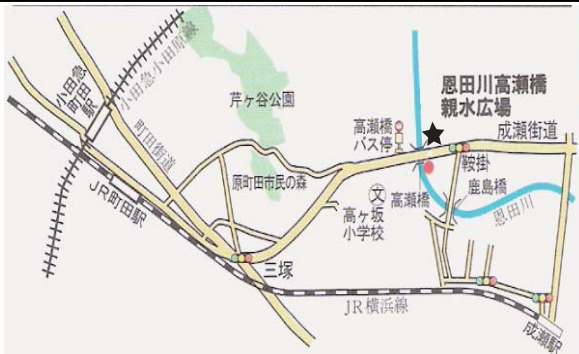
恩田川・高瀬橋 9:30 ~ 11:30