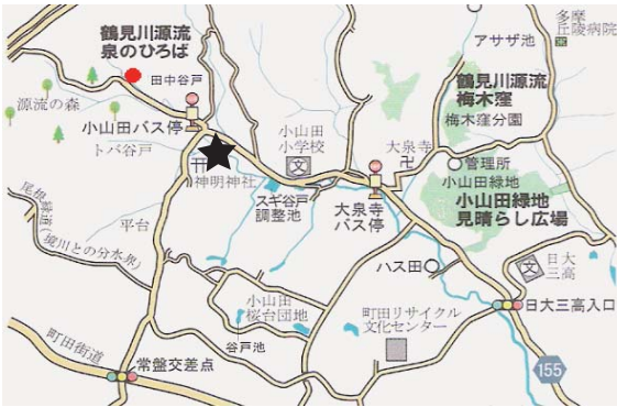
みつやせせらぎ公園丸池 10:30 ~ 12:30